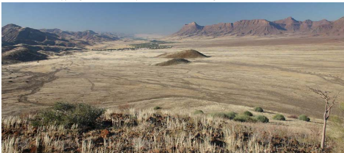
uitzicht over de Hoarusib valey

We starten met de Hoarusib rivier en later de Khumib rivier waar we langs en door de bedding zullen rijden. Ook hier maken we weer kans om diverse soorten wild tegen te komen. Ook zien we hier af en toe Himba dorpjes, gedurende de trip zullen we er in ieder geval één bezoeken.