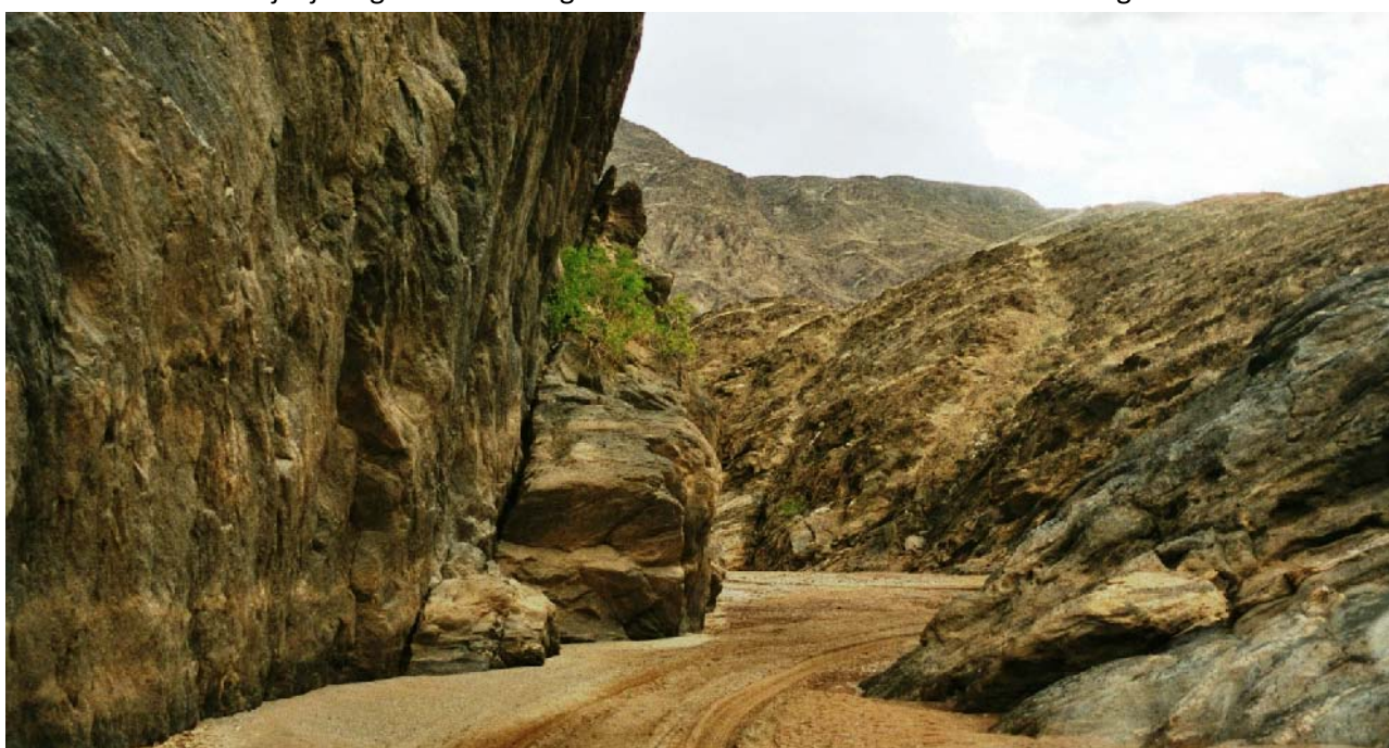
smalle passage in de Hoanib rivier.

Na het skelettonpark rijden we damaraland in. Hier zal het landschap zich van zee en zout gaan veranderen van steen landschap naar Afrikaans savanne. Gedurende deze twee dagen gaan we al veel zien aan landschappen en wild. In de rivierbedding van de Hoanib rivier kunnen we zelfs al woestijn olifanten. Verder leven in het gebied waar we nu zijn (en wat niet is omheind) Giraffes, Zebra's neushoorns, Cheeta's en luipaarden. Gemsbok, Hartebeest, Kudu en diverse andere bokken hebben we waarschijnlijk al gezien. Als we geluk hebben kunnen we zelfs Leeuwen tegenkomen.